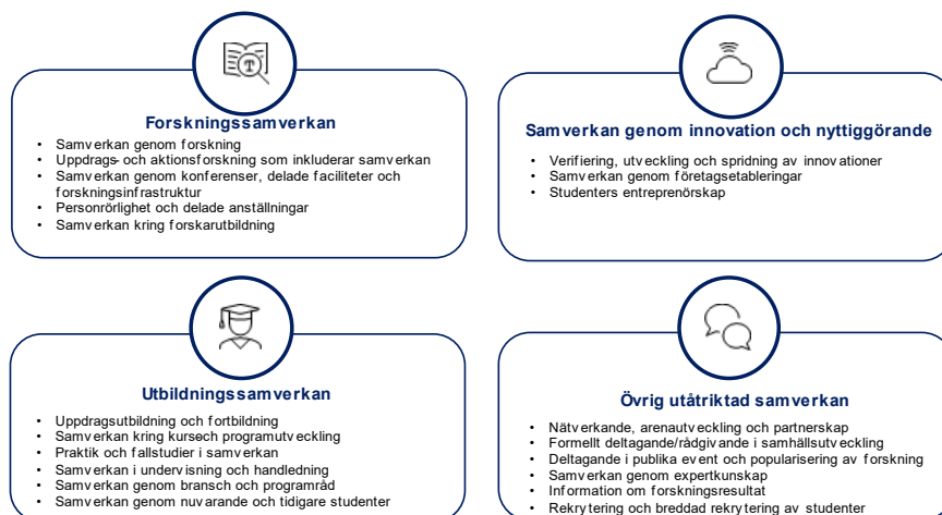
Bild 1. Fyra samverkansprocesser