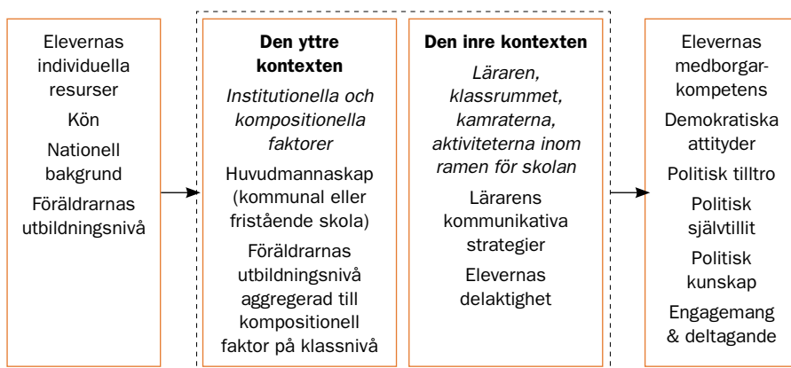
Figur 4.3 Analysmodellen

Utfallsvariabeln operationaliseras med följande frågor, från ICCS-undersökningens elevenkät: (1) Demokratiska värderingar : attityd till jämställdhet, attityd till invandrare; (2) Politisk tilltro : förtroende för institutioner, förtroende för politiker; (3) Politisk självtillit : politisk självtillit; (4) Politisk kunskap : kunskapsprovet i ICCS; och (5) Engagemang och deltagande : skoldemokratiskt deltagande, för-